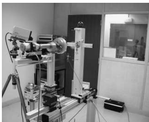
Fig. 2. - Irradiateur BSS2 face à la chambre à extrapolation PTW.

L'impossibilité de renouveler la source de ^{204}\text{Tl} faute de fournisseur, a incité le LNE-LNHB à privilégier le ^{85}\text{Kr} comme source de substitution mais a nécessité l'acquisition d'un nouvel ensemble d'irradiation et l'établissement de nouvelles références en termes d'équivalent de dose directionnel. Après diverses adaptations mécaniques de l'irradiateur, les mesures de caractérisation des trois sources ( ^{90}\text{Sr} - ^{90}\text{Y} , ^{85}\text{Kr} et ^{147}\text{Pm} ) avec filtre ISO ont été effectuées en 2004 et ont permis de déterminer le débit de dose absorbée et l'équivalent de dose directionnel à incidence normale, à la profondeur de 0,07 mm dans les tissus. L'instrument étalon est une chambre d'ionisation à extrapolation. Cette chambre possède un volume de collection variable par déplacement de l'électrode de collection à l'aide d'une vis micrométrique. Le débit de dose absorbée dans les tissus à la profondeur de référence est obtenu à partir de la détermination de la pente de la droite « courant corrigé K \cdot I = f(l) , K étant le facteur de correction et l étant la profondeur de la chambre » extrapolée à une profondeur de chambre égale à 0 selon la méthode décrite dans la norme ISO 6980.